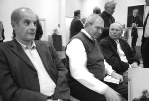
Blicke ins Auditorium